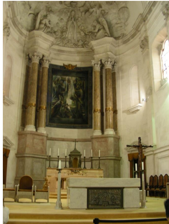
Cœur de la basilique du Rosaire