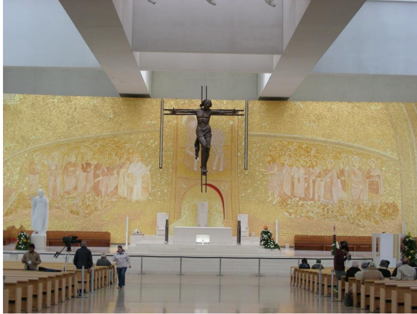
Intérieur du Centre pastoral Paul VI

Le site est très grand mais il ne semble pas y avoir d'indications où se diriger. Au hasard, nous descendons des escaliers qui nous mènent dans un sous-sol. Nous y trouvons une bonne dizaine de chapelles. Chaque chapelle doit pouvoir contenir environ trois cents personnes mais encore là, rien d'extraordinaire ou de rappel que nous sommes sur le site des apparitions.