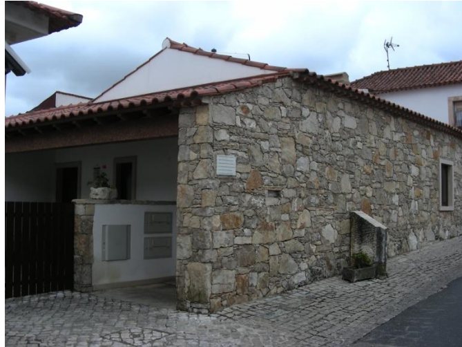
La maison Marto

À la sortie de cette maison nous remarquons le mur de l'autre côté de la route; c'est le mur devant lequel la photo la plus populaire des enfants fut prise.