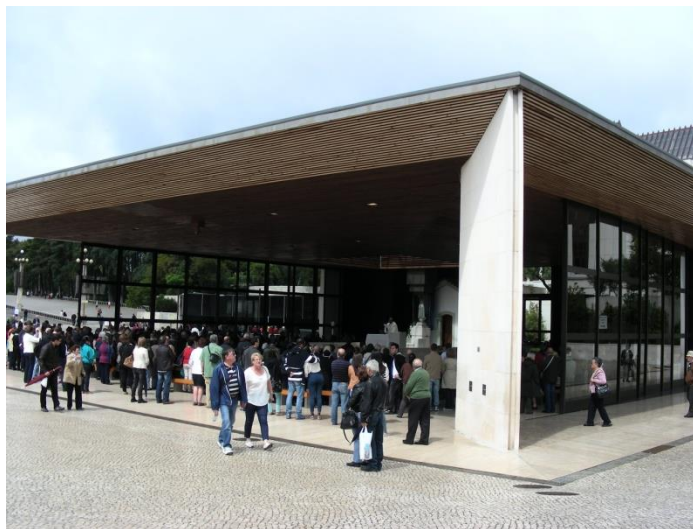
Chapelle des apparitions

Nous sortons et voyons enfin un bureau d'information pour touristes. On nous y donne quelques informations et une carte des lieux. Munis de ces informations, nous pouvons débiter la vraie visite. Il y a une messe et nous y faisons halte. C'est en portugais mais la messe qu'elle soit dans une langue ou une autre reste la messe.