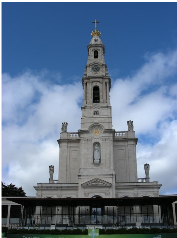
Basilique du Rosaire