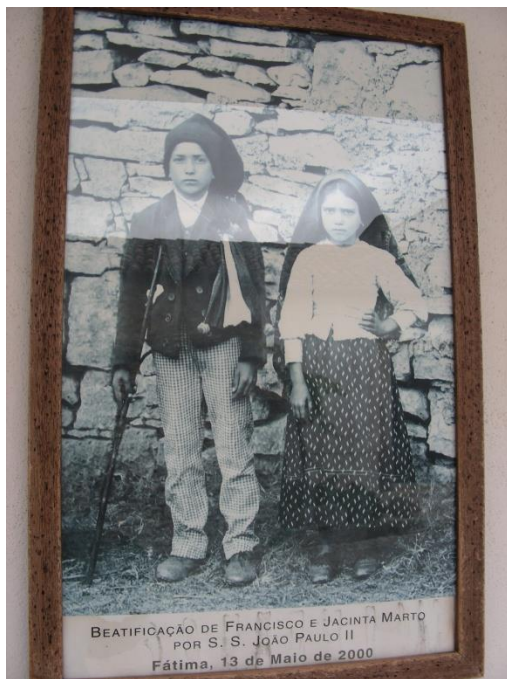
Les enfants devant le mur de la bergerie

À la sortie de cette maison nous remarquons le mur de l'autre côté de la route; c'est le mur devant lequel la photo la plus populaire des enfants fut prise.