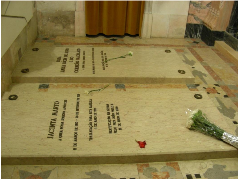
Tombe de Jacinthe et Lucie (Basilique du Rosaire)

C'est en mai 1951 que les restes mortels de Jacinta Marto furent transférés du cimetière de Fátima à la Basilique du Rosaire. Le 13 mai 1952 ce fut le tour des restes mortels de Francisco Marto, d'y être transférés. Et Lucie, décédée en 2005, vint trouver ses compagnons.