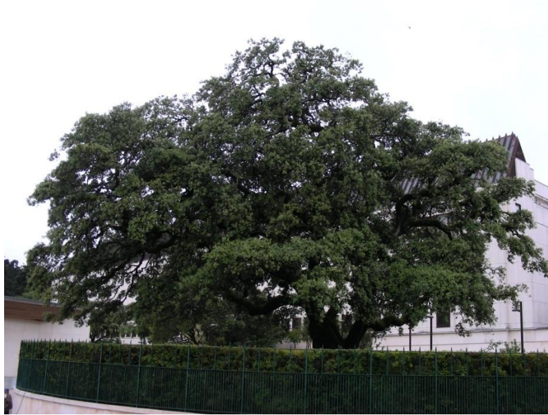
Chêne des apparitions